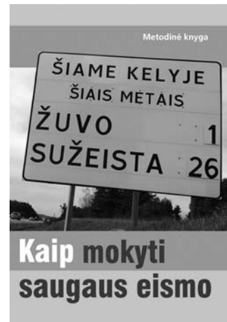
Metodinės knygos „Kaip mokyti saugaus eismo“ viršelis

Komplektas išleistas bendromis Policijos departamento Eismo priežiūros tarnybos, Švietimo ir mokslo ministerijos ir Lietuvos suaugusiųjų švietimo ir informavimo centro pastangomis, reaguojant į kasdienį „karą keliuose“.