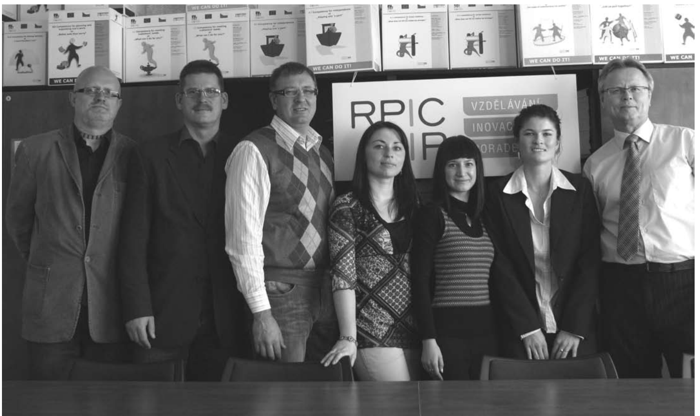
Lietuvos ir Čekijos ekspertų susitikimas

Numatoma ir ateityje plėtoti Lietuvos ir Čekijos bendradarbiavimą šioje srityje.