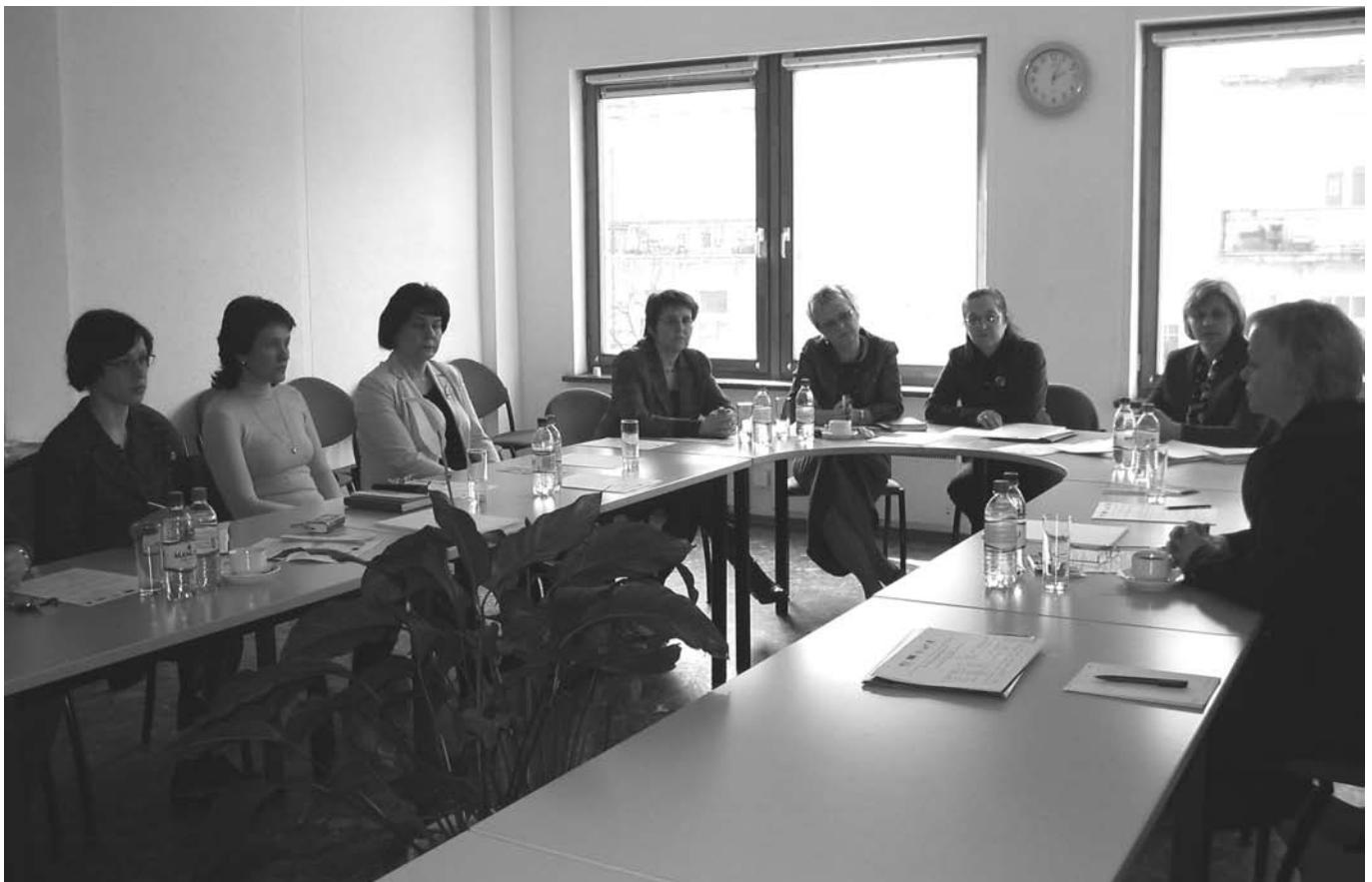
Verslumas reiškia žmogaus sugebėjimą idėjas paversti veiksmis