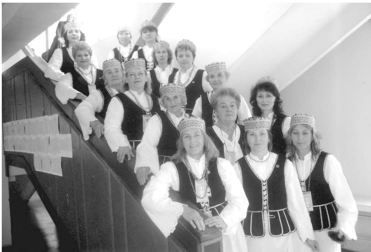
„Neskaičiuojam, kiek dainų mokam...“