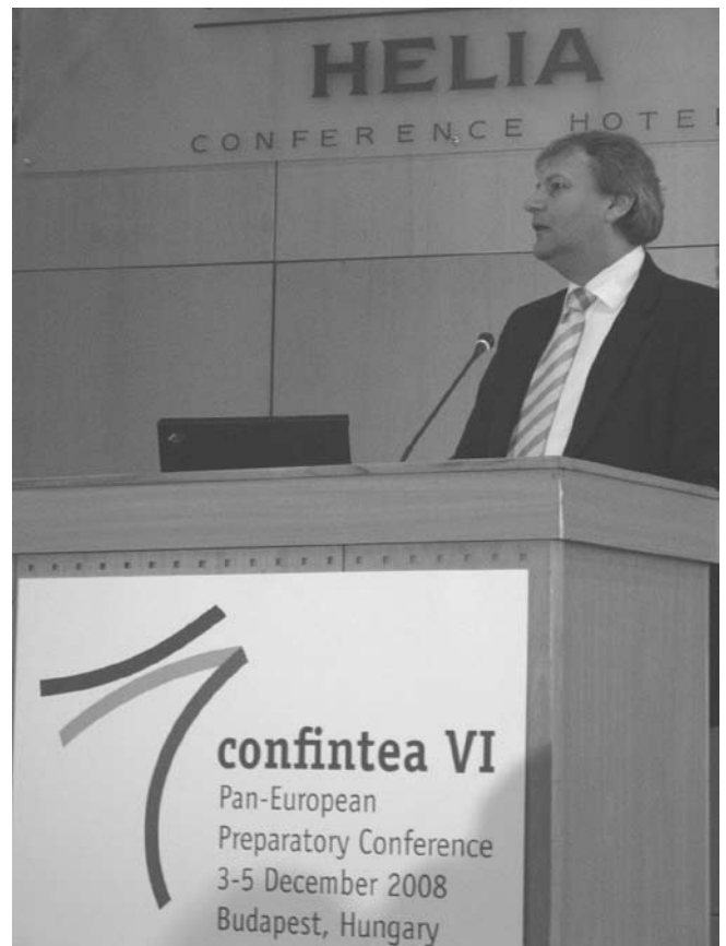
Vengrijos švietimo ministras István Hiller

2008 m. gruodžio 3–5 d. Budapešte vykusioje UNESCO paneuropinio regiono, apimančio Europą, Šiaurės Ameriką ir Izraelį, konferencijoje, kurioje dalyvavo daugiau kaip 200 suaugusiųjų švietimo ekspertų iš 33 šalių, taip pat ir iš Lietuvos, priimta deklaracija apie suaugusiųjų švietimą.